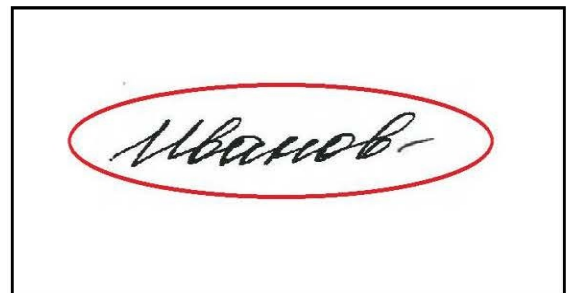
Место для подписи